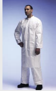
Blanc : TYV PL30S WH 00

Taille / Référence de commande : M (C11054701) / L (C11054719) / XL (C11054721) / XXL (C11054737)