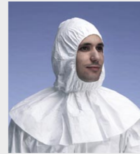
Blanc : TYV PH30S WH L0

Taille / Référence de commande : Taille unique (C11054670)