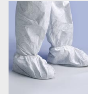
Blanc : TYV POS0S WH 00

Taille / Référence de commande : Taille unique (C11054667)