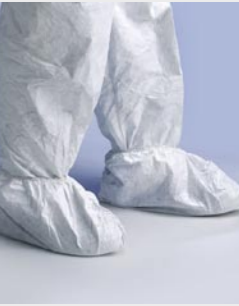
Blanc : TYV POSAS WH 00

Taille / Référence de commande : 36 à 42 (C11647199) 42 à 46 (C11647207)