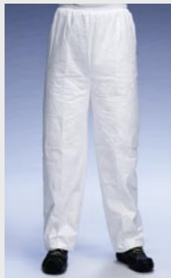
Blanc : TYV PT31S WH L0

Taille / Référence de commande : M (C11054600) / L (C11054611) / XL (C11054628) / XXL (C11054632)