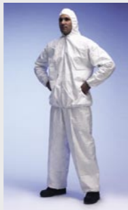
Blanc : TYV PP33S WH 00

Taille / Référence de commande : S (C10954518) / M (C10954539) / L (C10954556) / XL (C10954566) / XXL (C10954586)