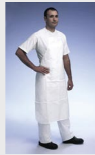
Blanc : TYV PA30S WH L0

Taille / Référence de commande : Taille unique (C11054695)