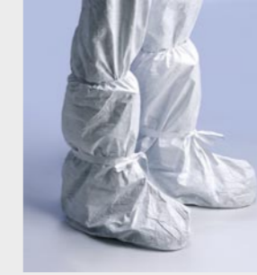
Blanc : TYV POB0S WH 00

Taille / Référence de commande : Taille unique (C11054644)