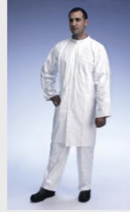
Blanc : TYV PL30S WH NP

Taille / Référence de commande : S (C11309677) / M (C11309682) / L (C11309692) / XL (C11309701) / XXL (C11309712)