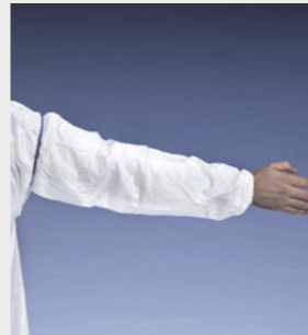
Blanc : TYV PS32S WH LA

Taille / Référence de commande : Taille unique (C11340778)