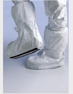
Blanc : TYV POBAS WH 00

Taille / Référence de commande : Taille unique (C11054659)