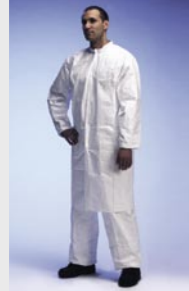
Blanc : TYV PL30S WH 09

Taille / Référence de commande : S (C11309729) / M (C11309733) / L (C11309745) / XL (C11309759) / XXL (C11309760)